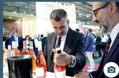
Decaro al Vintaly a Verona: «La Puglia non è più la sorpresa del panorama enologico»