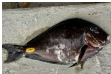
SCIENZA Il pesce con le «damette» della Liberia arriva nel mare Adriatico: può causare ferite profonde agli umani